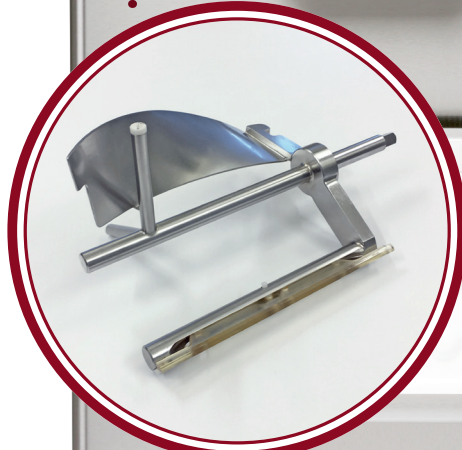
agitatore Pasticceria Pastry beater