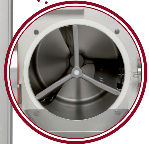
agitatore Elite Elite beater