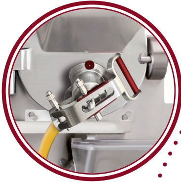
uscita laterale side exit